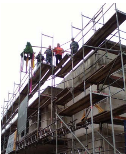
Ein großer Moment: Das Richtfest am 16.10.2015 lockte trotz des regnerischen Wetters viele auf die Baustelle. Die Kita-Kinder trugen drinnen ihr Lied vor: „Wer will fleißige Handwerker sehn“.