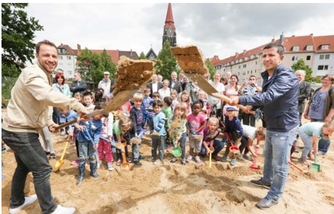
Als Schirmherren für den Neubau gaben Steven Cherundolo und Altin Lala am 18.06.2015 mit dem ersten Spatenstich den Startschuss - kräftig unterstützt von den Kindern der ausgelagerten Kita St. Joseph.

Man merkt: Wir sind durchaus stolz auf unser FORUM, vor allem aber sind wir dankbar: So viele Mitglieder und Freunde unserer Gemeinde haben uns in den vergangenen Jahren unterstützt, schon in der Planung, dann aber vor allem durch die Übernahme von Patenschaften für die Boden-Quadratmeter des Neubaus. Nicht zu vergessen ist auch, dass die Gemeinde in den letzten Jahren auf viele liebgewonnene Aktivitäten verzichten musste, vieles wurde durch den Raummangel kompliziert: Chöre, Senioren, die Kolpingsfamilie, die Kommunionkinder und ihre Katecheten – sie alle mussten sich arrangieren und haben das flexibel und unkompliziert getan. Und alle, die den sonntäglichen Kirchenkaffee besuchen, werden wohl bestätigen, dass es zwar durchaus seinen Reiz hat, in der Kirche zusammen zu kommen, dass wir uns aber auf die Helligkeit und Weite des FORUMs freuen.