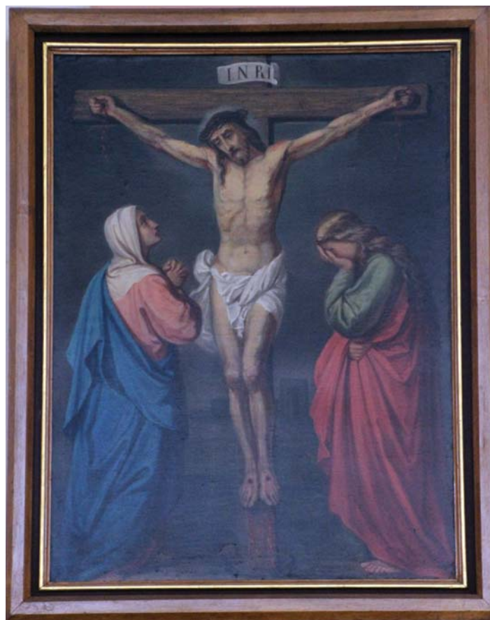
St.Christophorus-Kirche Unzhurst 12. Kreuzwegstation: Jesus stirbt am Kreuz

Karl Jenkins (*1944) ist ein walisischer Komponist, der in sehr verschiedenen musikalischen Bereichen tätig ist. Seine kirchenmusikalische Prägung erhielt er durch seinen Vater, der Organist und Chorleiter war. Während seines Studiums klassischer Musik - instrumentale Ausbildung zum Oboisten - war er in den 1960er Jahren Mitglied verschiedener Jazz-Rock Formationen und ließ sich von der Minimalmusic sowie zeitgenössischer Popmusik, aber auch von geistlicher Chormusik und ethnischer Musik beein-flussen.