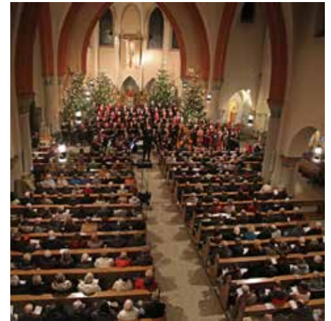
Chorkonzert zum Dreikönigsfest 2018

(aus Petra Rapp: Nackt im Chor kommt selten vor, 2012 2 / Abdruck mit freundlicher Genehmigung der Autorin)