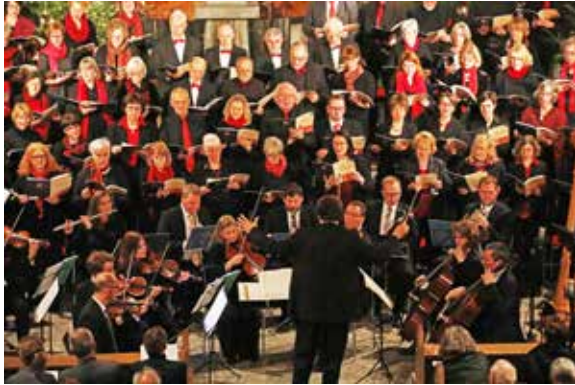
Der Projektchor St. Joseph 2017/2018

Ein Projektchor ist bekanntlich etwas, woraus man Kraft schöpft – etwas, das Würze ins Chorleben bringt und einen innerlich wärmt. Eine Art Rot-Kreuz-Gulasch-Kanone der Chorgemeinschaft quasi.