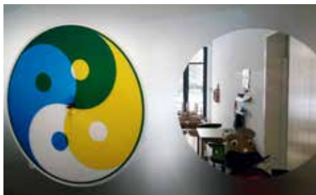
Fenster zum Flurbereich erlauben einen Einblick in die Gruppenräume, ohne dass die Kinder sich gestört fühlen.

Seit Januar 2018 bieten wir einmal in der Woche in unserem Turnraum einen Babymassage-Kurs an, damit wir auch für die Kleinsten im Stadtteil und der Gemeinde etwas anbieten können und so der erste Kontakt zur Kita hergestellt werden kann.