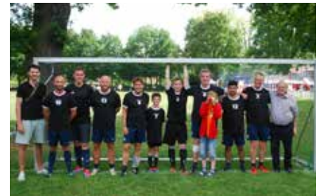
Das St. Joseph-Team war 2017 mit Begeisterung dabei und schaffte es bis zum Achtelfinale. Ist 2018 mehr drin?

Der Lionscup Hannover Löwenbastion lädt wieder ein. Anpfiff ist am Sonntag, 10. Juni um 10 Uhr auf dem Sportplatz der SG 74, In der Steintormasch 48. Im letzten Jahr waren die St. Joseph-Kickers zum ersten Mal dabei. Sicher hat der Hl. Luigi dazu beigetragen, dass wir uns gut geschlagen haben. Auch in diesem Jahr werden wir an diesem Turnier teilnehmen und dabei helfen, dass am Ende wieder über 10.000 € an „Kinderherz Hannover e.V.“ gespendet werden. Um den Lionscup herum findet ein großes Familienprogramm statt. Es lohnt sich also, sich diesen Termin in den Kalender einzutragen.