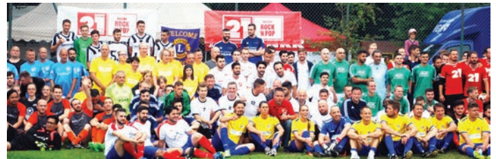
Die Teams beim Lionscup 2018

Lust mitzuspielen. Dann erkundigen Sie sich im Pfarrbüro St. Joseph, Tel. 0511 663282.