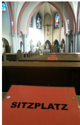
Nur 80 Gläubige finden zurzeit Platz im Gottesdienst.