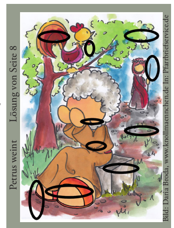
Petrus weint Lösung von Seite 8